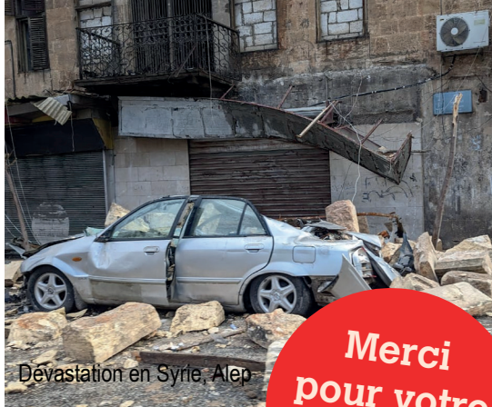
Dévastation en Syrie, Alep