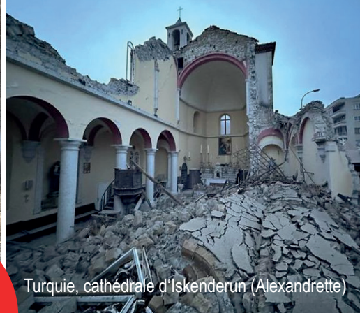
Turquie, cathédrale d'Iskenderun (Alexandrette)