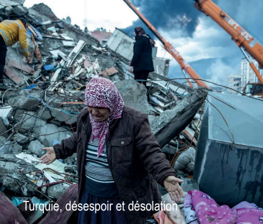
Turquie, désespoir et désolation