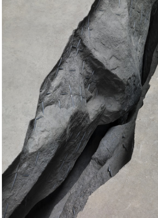
© Doris Salcedo, The Unilever Series: ris Salcedo, Shibboleth, October 2007-April 2008, Turbine Hall, Tate Modern, London 2017

Les menaces, la discrimination, les persécutions, la violence arbitraire et le refus de l'État de protéger les frères et sœurs chrétiens, surtout dans les pays islamiques, constituent une attaque contre l'unité de la communauté ecclésiale et touchent les Églises partout dans le monde. Pour la liberté, la sécurité, la protection et le bien de leurs frères et sœurs, les chrétiens et les chrétiennes, les détenteurs d'une charge ecclésiale – l'Église dans son ensemble – ne peuvent faire autrement qu'intervenir en faveur des personnes qui souffrent, se solidariser avec elles et défendre politiquement leur cause. Cela inclut l'examen des critères que l'État applique pour la reconnaissance des demandeurs d'asile et des réfugiés, tout autant qu'un suivi critique des procédures de refus et d'expulsion. Il ne peut y avoir d'Église ici sans Église là ! Cette exigence n'est pas un objectif politique, mais la mission, fondée sur le message de l'Évangile, de l'Église une dans le monde.