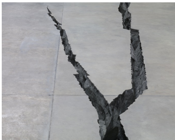
© Doris Salcedo, The Unilever Series: ris Salcedo, Shibboleth, October 2007–April 2008, Turbine Hall, Tate Modern, London 2017

humains qui vivent sur un territoire national sans en être citoyennes ou citoyens. Ces derniers ont part au droit sans disposer de garanties illimitées de pouvoir rester. Leur séjour dépend d'une part de l'intérêt que l'État en question peut avoir à les faire demeurer – comme main-d'œuvre bienvenue – et, d'autre part, de dispositions nationales et internationales. La différence entre les droits civiques et les droits de l'homme marque la frontière entre le politique et l'humanitaire. Celui ou celle qui ne dispose pas de droits politiques d'appartenance en qualité de citoyenne ou citoyen se sait simple être humain démuné, avec les droits de l'homme pour seul appui.