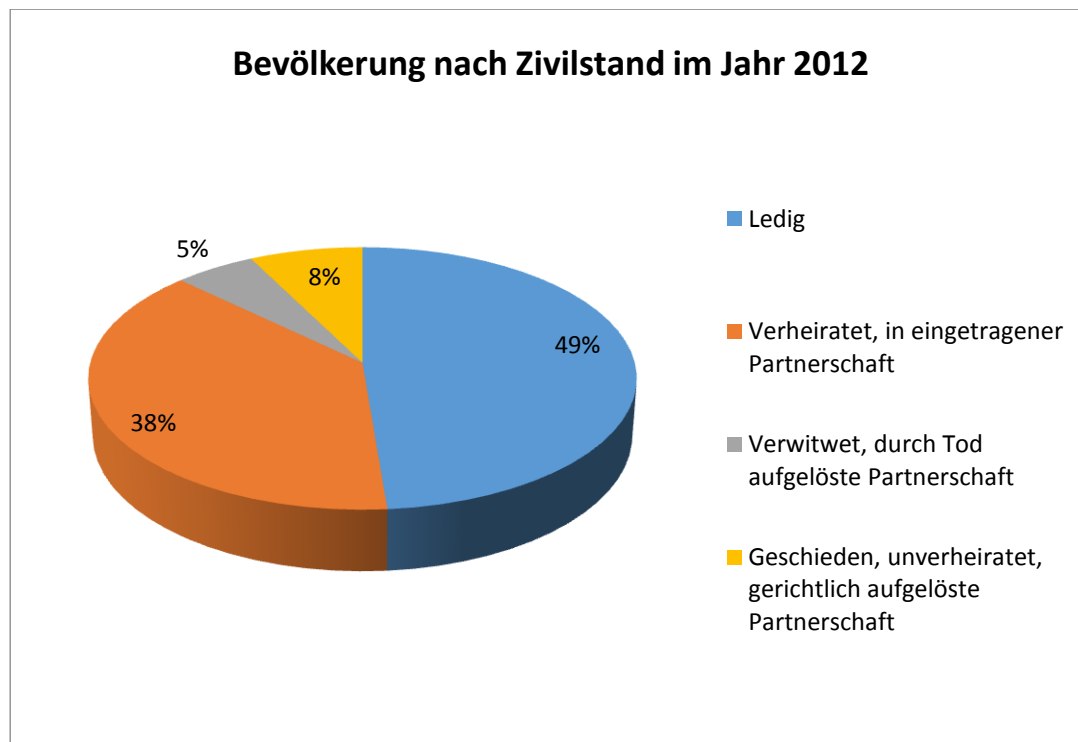
Graphique: Population selon l'état civil 4